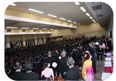
卒業生による ハレルヤコーラス