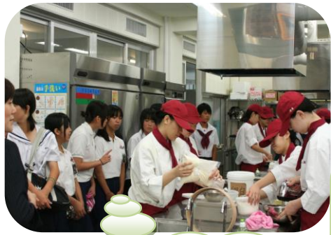
校内見学 (製菓実習室)