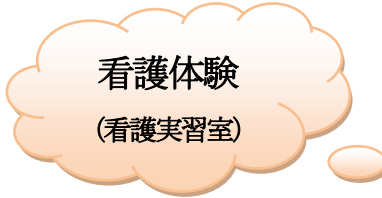
看護体験 (看護実習室)